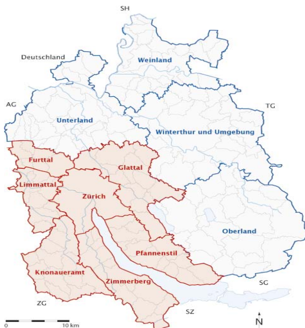
Abbildung 6: Die Planungsgruppen der RZU