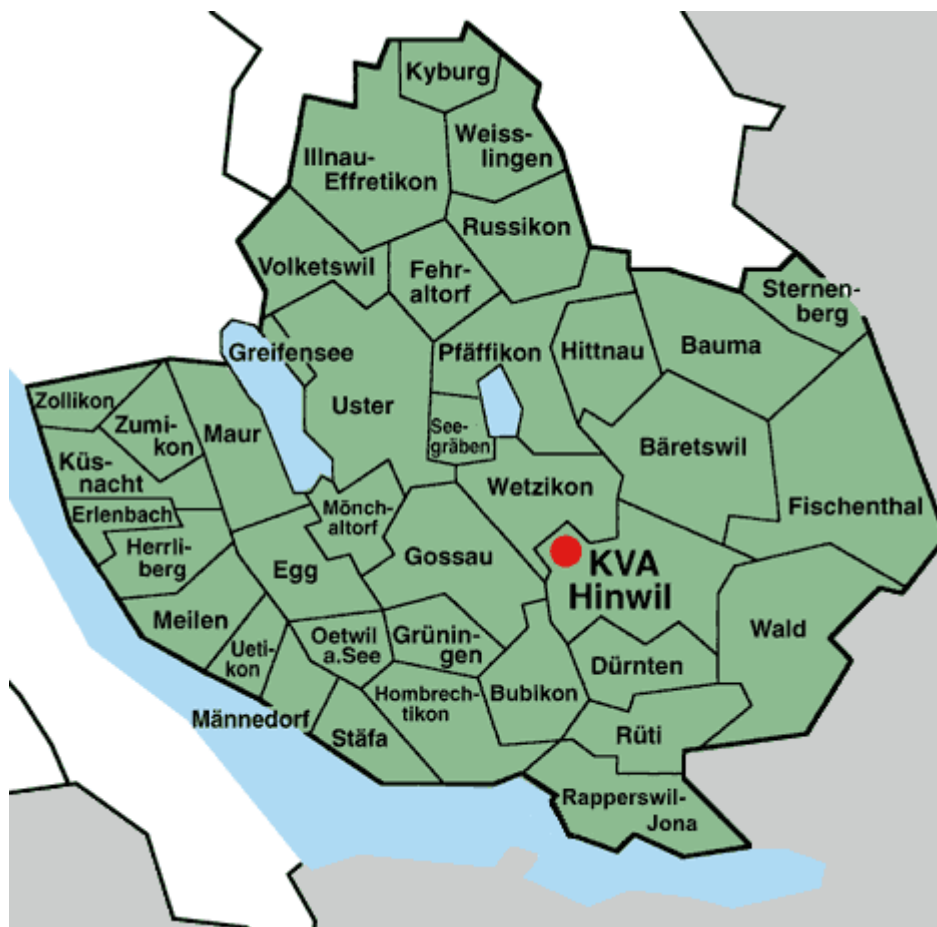
Abbildung 3: Die Gemeinden der KEZO