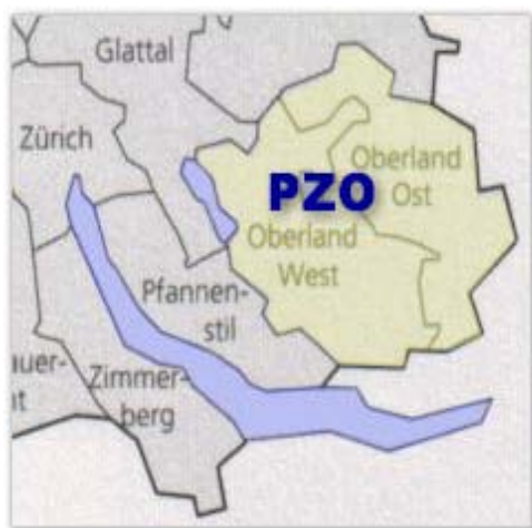
Abbildung 5: Die Gemeinden der PZO