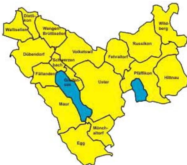
Abbildung 7: Die Verbandsgemeinden des Spitals Uster