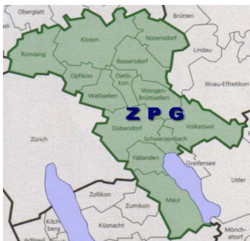
Abbildung 10: Die Gemeinden der ZPG