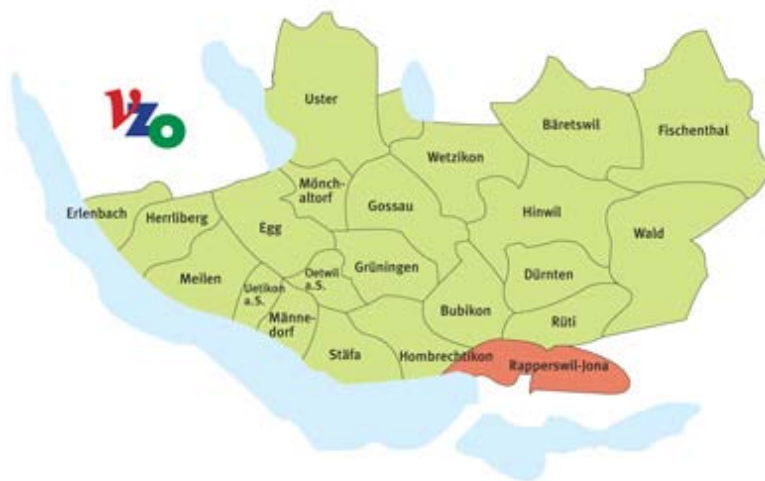
Abbildung 9: Das Marktgebiet der VZO