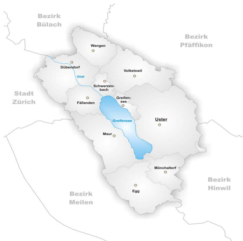
Abbildung 2: Die Gemeinden des Bezirks Uster